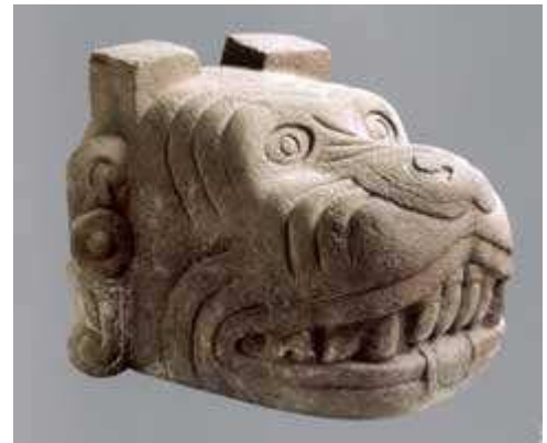
Escultura de XOLOTL que significa a la vez perro y gemelo

El 'Fuego Sexual', el perro, el instinto erótico, . LUCIFER-NAHUATL, es aquel agente extraordinario y maravilloso que puede transformarnos radicalmente