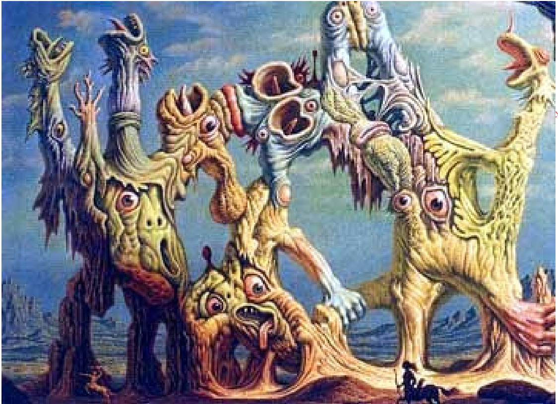
LAMINA DE JOHFRA

No me he olvidado de la pregunta, ni me estoy desviando a otra respuesta. Ya os advertí que necesitaba tiempo para daros la contestación; estoy explicando a qué muerte se han lanzado los esoteristas equivocadamente, y no han muerto como se les enseñó porque estudiaron las escrituras a la letra muerta, y la letra muerta mata.